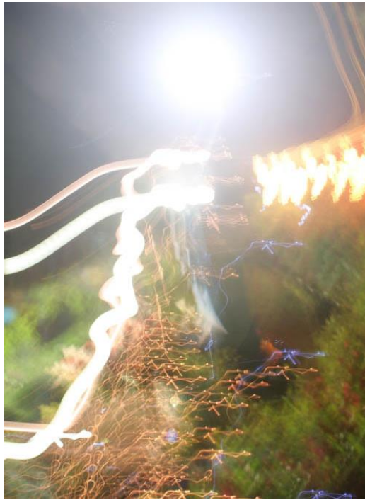
La lumière claire rayonnée de la Vierge au 16 mai 2006

Jésus dit : « Je me suis déjà entièrement donné en répandant mon Sang pour le salut de tous, même des pécheurs les plus pervers qui ont transgressé la dignité de Dieu. Que ne vous donnerais-je pas à vous qui me cherchez ? Ma mère et moi sommes consolés en voyant vos cœurs pleins d'amour pour la conversion des pécheurs et Il fit briller la lumière sur tous ceux qui étaient présents et les bénis. Chers pèlerins, que la même lumière descende sur chacun de vous !